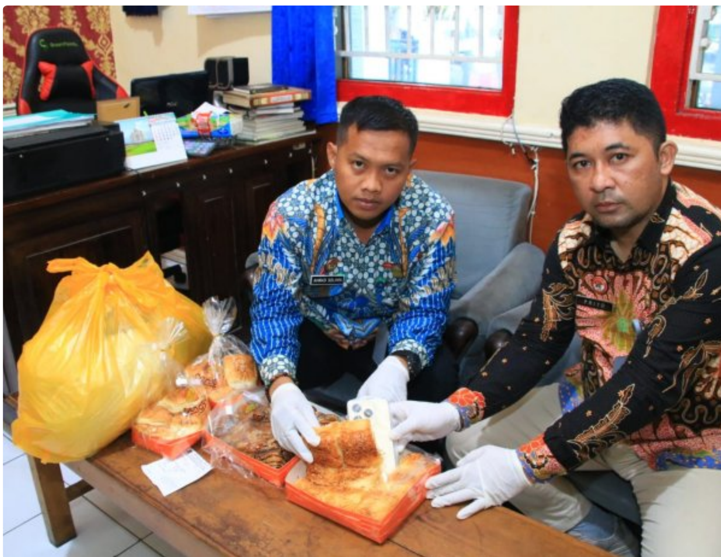
Petugas Lapas Banyuwangi berhasil menggagalkan penyelundupan HP ke dalam lapas

BANYUWANGI - Petugas Lembaga Pemasyarakatan (Lapas) Kelas IIA