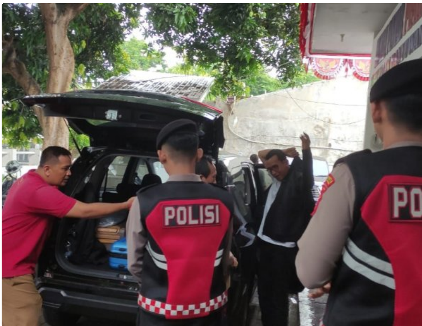
Personel Polresta Banyuwangi melakukan pengawalan ketat proses pengiriman hasil penghitungan surat suara Pilgub Jatim 2024 ke KPU Jatim

BANYUWANGI – Polresta Banyuwangi memberikan pengawalan ketat proses